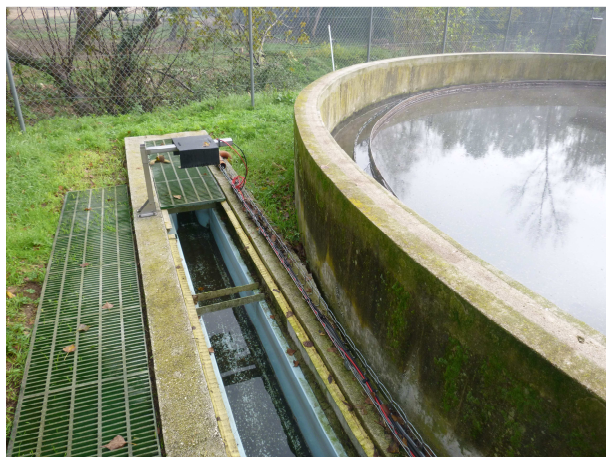
Venturi sur le canal de sortie – novembre 2014