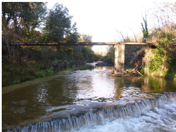
Vue vers l'amont – novembre 2014