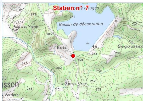
Scan IGN au 1 : 25 000