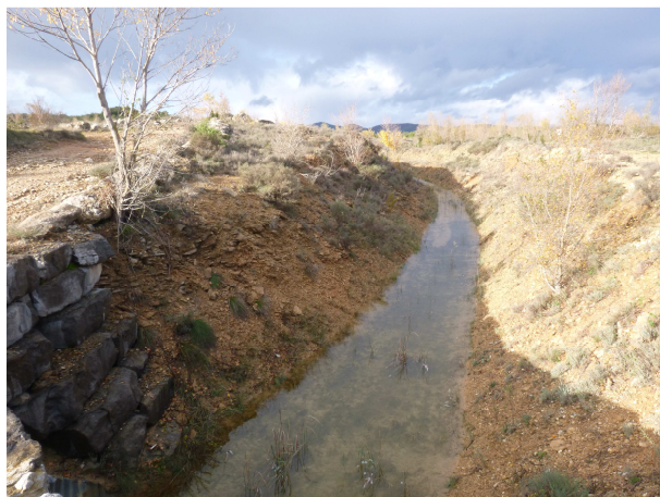
Canal de surverse – novembre 2014