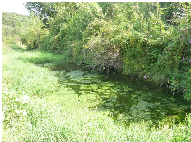
Vue vers l'aval du gué – août 2014