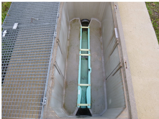
Venturi sur le canal de sortie – novembre 2014