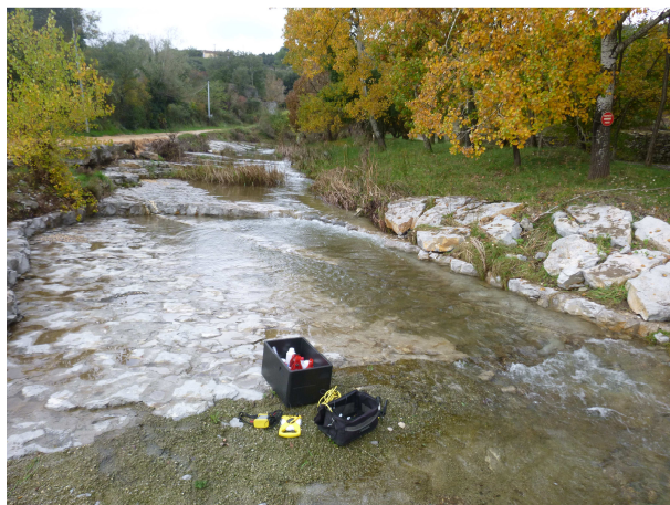
Vue vers l'amont du gué – novembre 2014