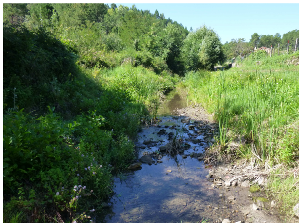
Vue vers l'amont du gué – août 2014