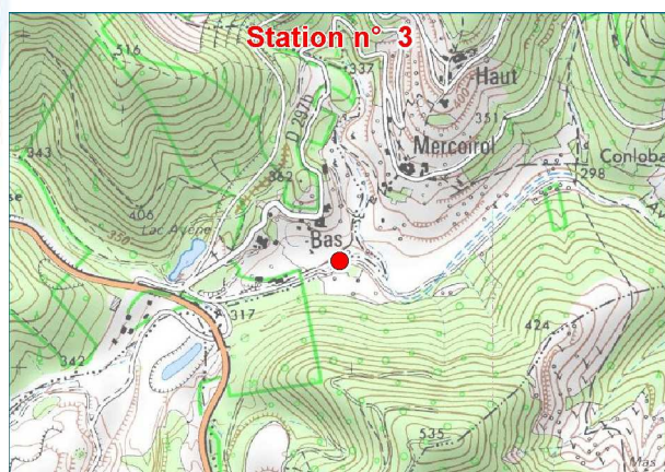
Scan IGN au 1 : 25 000