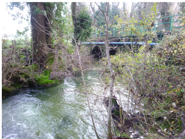
Vue vers l'aval – novembre 2014