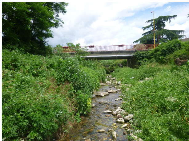
Vue vers l'aval – juin 2016