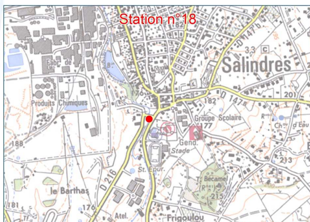
Scan IGN au 1 : 25 000