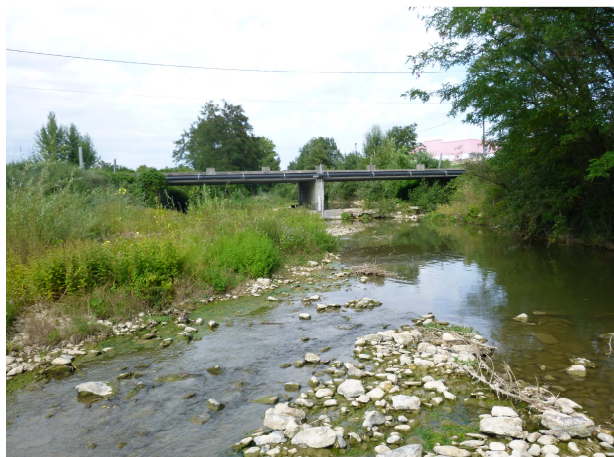
Vue vers l'aval – août 2014