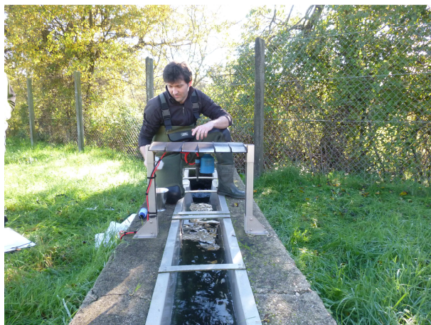
Venturi sur le canal de sortie – novembre 2014