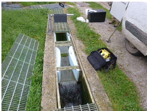
Venturi sur le canal de sortie – novembre 2014