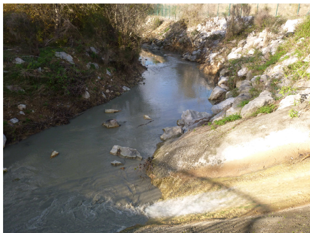
Goulotte du rejet – novembre 2014