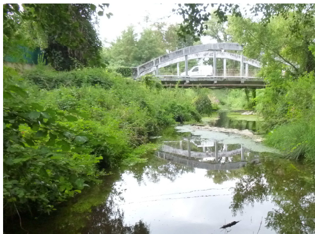
Vue vers l'aval – août 2014