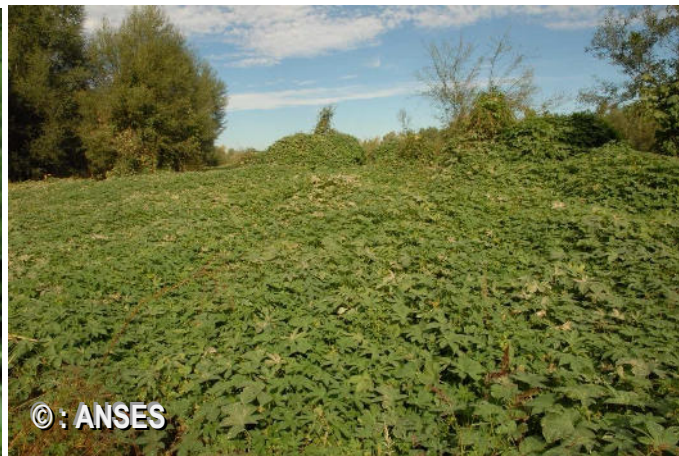
Exemple de milieu envahi sur les Gardons. Le houblon japonais est beaucoup plus couvrant que le houblon commun.