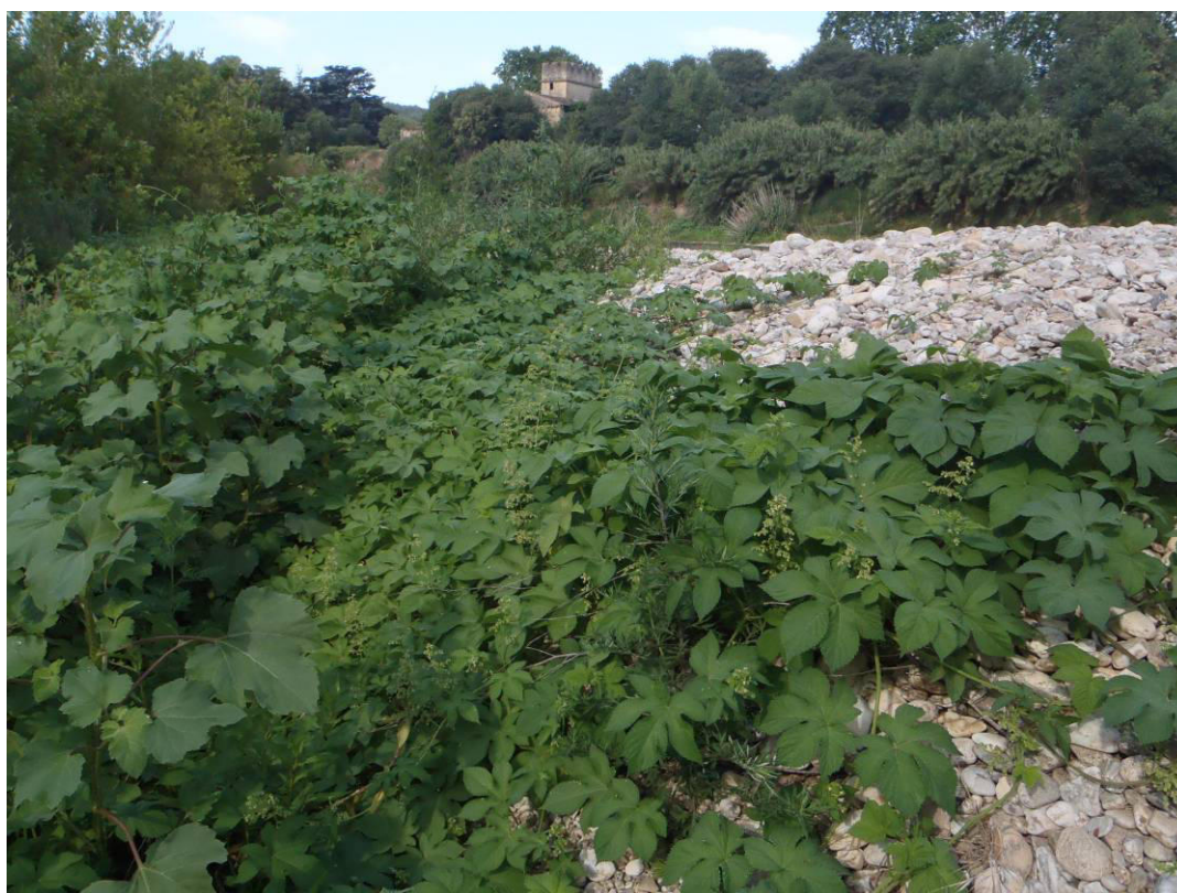
Atterrissement du Gardon colonisé par Humulus japonicus à Sainte Anastasie

Appel à décision sur l'opportunité d'une gestion.