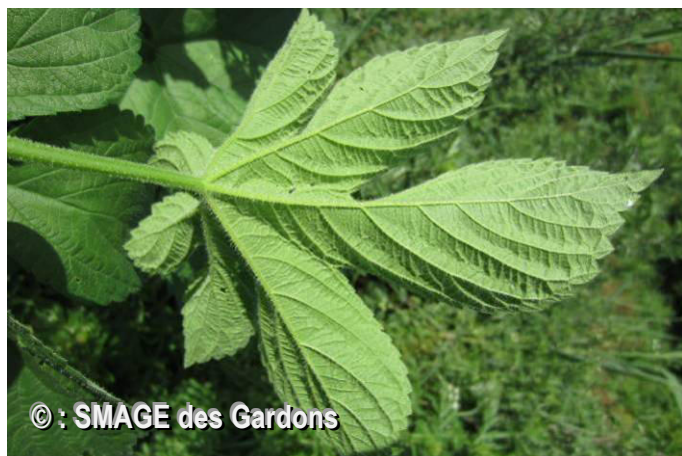
A l'inverse du houblon commun, le houblon japonais a 5 à 7 lobes et présente de nombreux poils sur sa tige et au revers de ses feuilles.

Le présent document expose synthétiquement l'état des connaissances acquises depuis 2012 dans le but qu'une décision collective sur la nécessité d'une intervention ou de non intervention, et les modalités de cette intervention (tant technique que financière) soit prise (cf dernier chapitre)